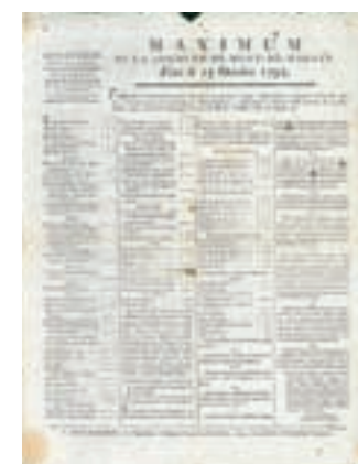
Tableau du Maximum des salaires et de quelques denrées alimentaires à Mont-de-Marsan, conformément à la loi du 29 septembre 1793, octobre 1793. AD 40, Ls 9

8 - Les suspects sont définis comme des ennemis de l'intérieur ; expliquez comment ils peuvent soutenir les ennemis de la Révolution à l'extérieur.