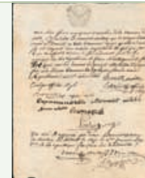
Certificat de civisme délivré par la municipalité de Saint-Pandelon, 29 ventôse an II (19 mars 1794). AD 40, 12 L 26