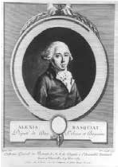
Alexis de Basquiat-Mugriet, gravure colorée, par Cernelle d'après un dessin de Laplace, Paris, 1789. Archives départementales des Landes, 13Fi/Basquiat 1.