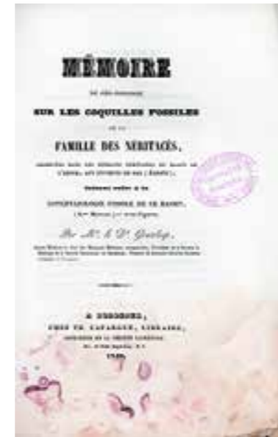
Couverture de Mémoire sur les coquilles fossiles de la famille des Néritacées observées dans les terrains tertiaires du Bassin de l'Adour, aux environs de Dax, de Jean-Pierre-Sylvestre de Grateloup, 1840. Archives départementales des Landes, Br 8° 231.