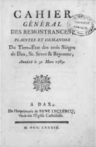
Cahier général de remontrances, plaintes et demandes du tiers-état des trois sièges de Dax, Saint-Sever et Bayonne, couverture, avril 1789. Archives départementales des Landes, III B8.

Panneau 10, documents 1 et 2 (CD atelier collège - 06 et 07)