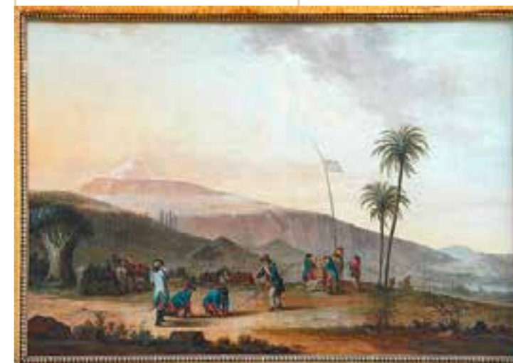
Jean-Charles de Borda (1733-1799), mesure du Pic de Ténériffe aux Canaries, peinture à l'huile attribuée à Pierre Ozanne, 1771-1776. Musée de Borda, Dax.