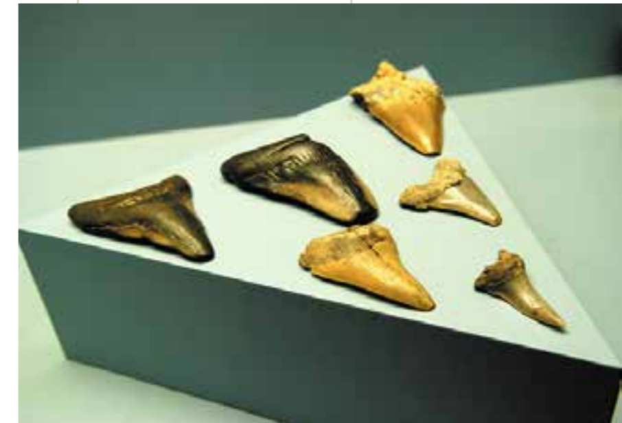
Collection de dents de requin récoltées par Jacques-François de Borda d'Oro, s.d.. Musée de Borda, Dax.

Panneau 7, document 2 et panneau 15, document 3 (CD atelier lycée-14 et 15)