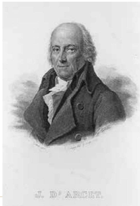
Jean d'Arcet, gravure, s.d., Archives départementales des Landes, 9 Fi 1.

Panneau 5, document 1 (CD atelier collège -05)