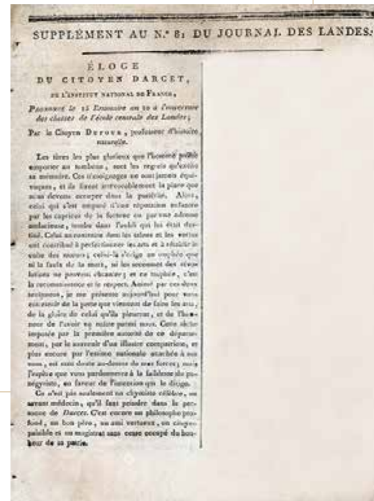
« Eloge du citoyen d'Arcet » par Charles Dufour, extrait, Journal des Landes, n°81 du 15 brumaire an X (6 novembre 1802). Archives départementales des Landes, Per PI° 1473.

Panneau 13, document 5 (CD atelier lycée-12)