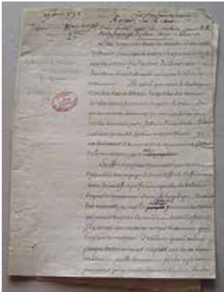
Extrait du cahier général de remontrances, plaintes et demandes du tiers-état des trois sièges de Dax, Saint-Sever et Bayonne, couverture, avril 1789. Archives départementales des Landes, III B8.