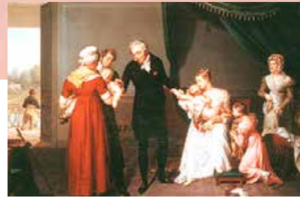
Le vaccin au château de Liancourt, peinture à l'huile par C. Desbordes, 1809. Musée de l'Assistance publique, Paris.