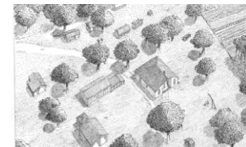
AD 40, 71 Fi 89