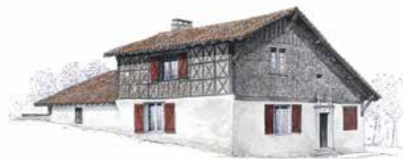
AD 40, 71 Fi 2

1 En utilisant les différentes cartes, le cadastre, la photographie et l'aquarelle à votre disposition, complétez le tableau pour les maisons de chaque zone.