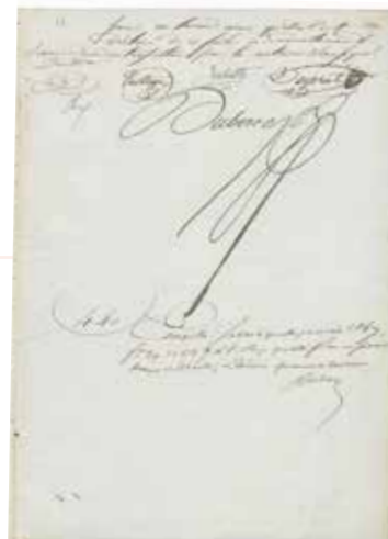
AD40, 3 E 26-47

Un inventaire après décès est un acte fait par un notaire qui liste les biens possédés par une personne après sa mort, ainsi que leur valeur. Il permet de les répartir entre ses héritiers.