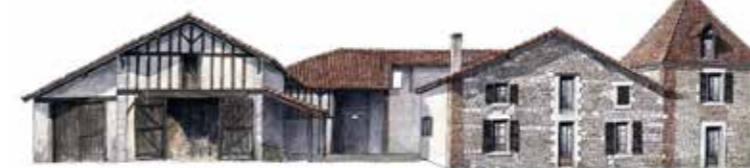
AD 40, 71 Fi 98