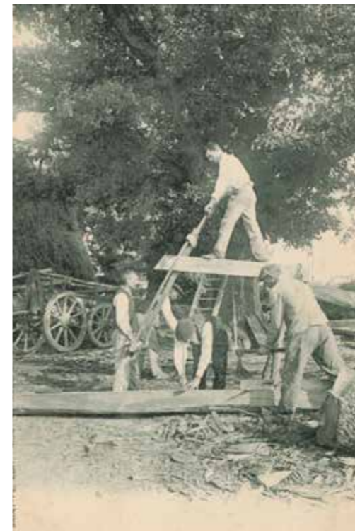
AD 40, 1 Fi 8408

Semelle : poutre en bois horizontale sur laquelle reposent les pans de bois formant les colombages.